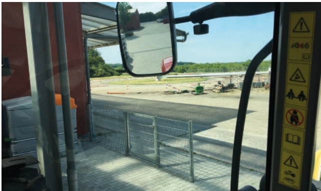
Direkte Sicht nach links

Bei der Überschreitung eines Abstandes von 3,5 m zwischen vorderem Ende des Anbaugerätes und der Mitte des Lenkrades sind Maßnahmen zu treffen, um die entstehende Sichtfeldeinschränkung auszugleichen (Merkblatt für angehängte Arbeitsgeräte – Bundesverkehrsblatt vom 27. 11. 2009). Damit wird eine Begleitperson als Einweiser erforderlich. Diese Praxis gefährdet die Person des Einweisers und ist bei der täglichen Arbeit in der Landwirtschaft kaum umsetzbar. Technische Maßnahmen in Form geeigneter visueller Unterstützung für den Fahrer können in diesem Fall Abhilfe schaffen.