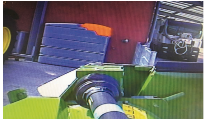
Indirekte Sicht nach links über den Monitor, bei an der Front montierter Kamera